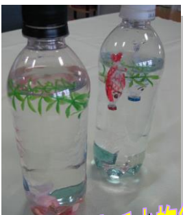
ペットボトルで水族館