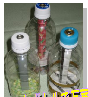
ペットボトルで万華鏡

申込方法 7月1日(木)から電話にて受付(平日 9:30~15:30) 申込先 伊勢リサイクルプラザ ☎0596-38-2800 開催時間 午前10時~正午 定員 各教室とも5組(先着順) 伊勢市、明和町、玉城町、度会町に在住の小学生と保護者 ※子供のみでの参加はできません 参加費 無料