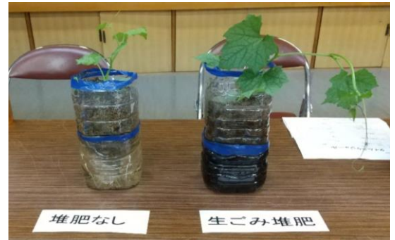
“違いがわかる” 生ごみ堆肥の効能！

土づくりは？ こんなに発芽したよ うまく生育できず・・・？ お互いの報告から学びます。