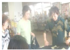
和服のリフォーム